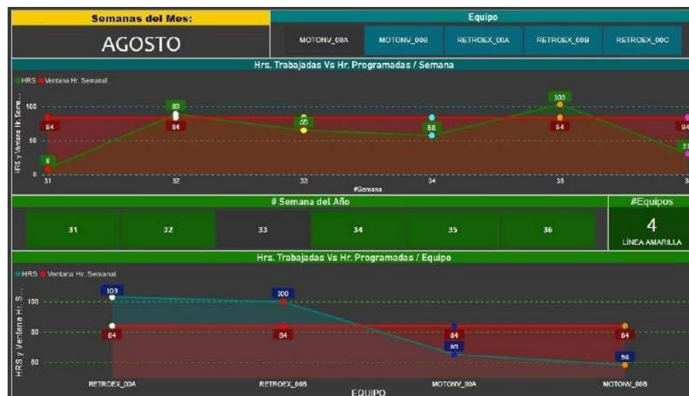
Dashboard de cumplimiento semanal de hrs.

Utilizar las opciones de modelamiento y funciones DAX avanzadas de Power BI, para elaborar informes y paneles con información en tiempo real de diferentes fuentes de datos. mpos de parada no programada de activos.