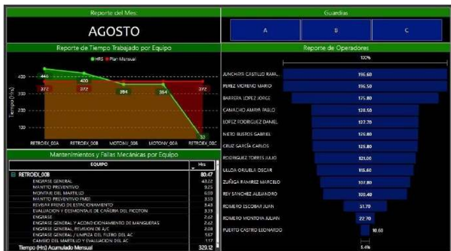
Dashboard de reporte mensual